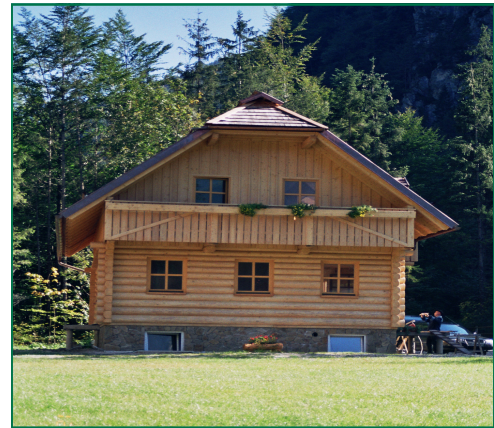
Hiša, izdelana iz lesenih brun.